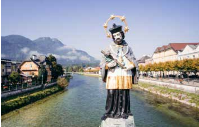
Statue des Hl. Johannes Nepomuk auf der Hauptbrücke