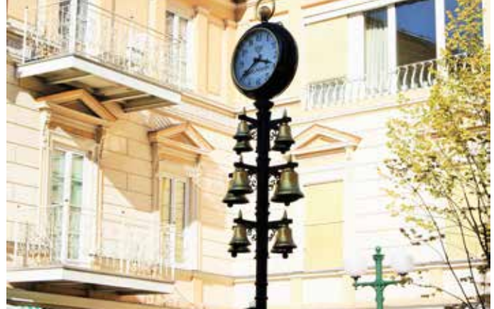
Bad Ischler Glockenspiel am Kreuzplatz