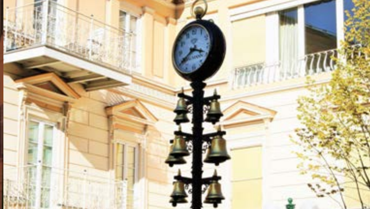
Bad Ischler Glockenspiel am Kreuzplatz