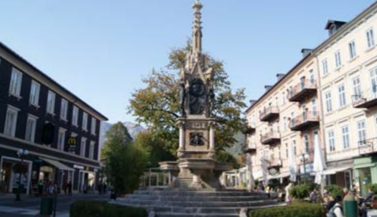
Franz Karl Brunnen am Schröpferplatz